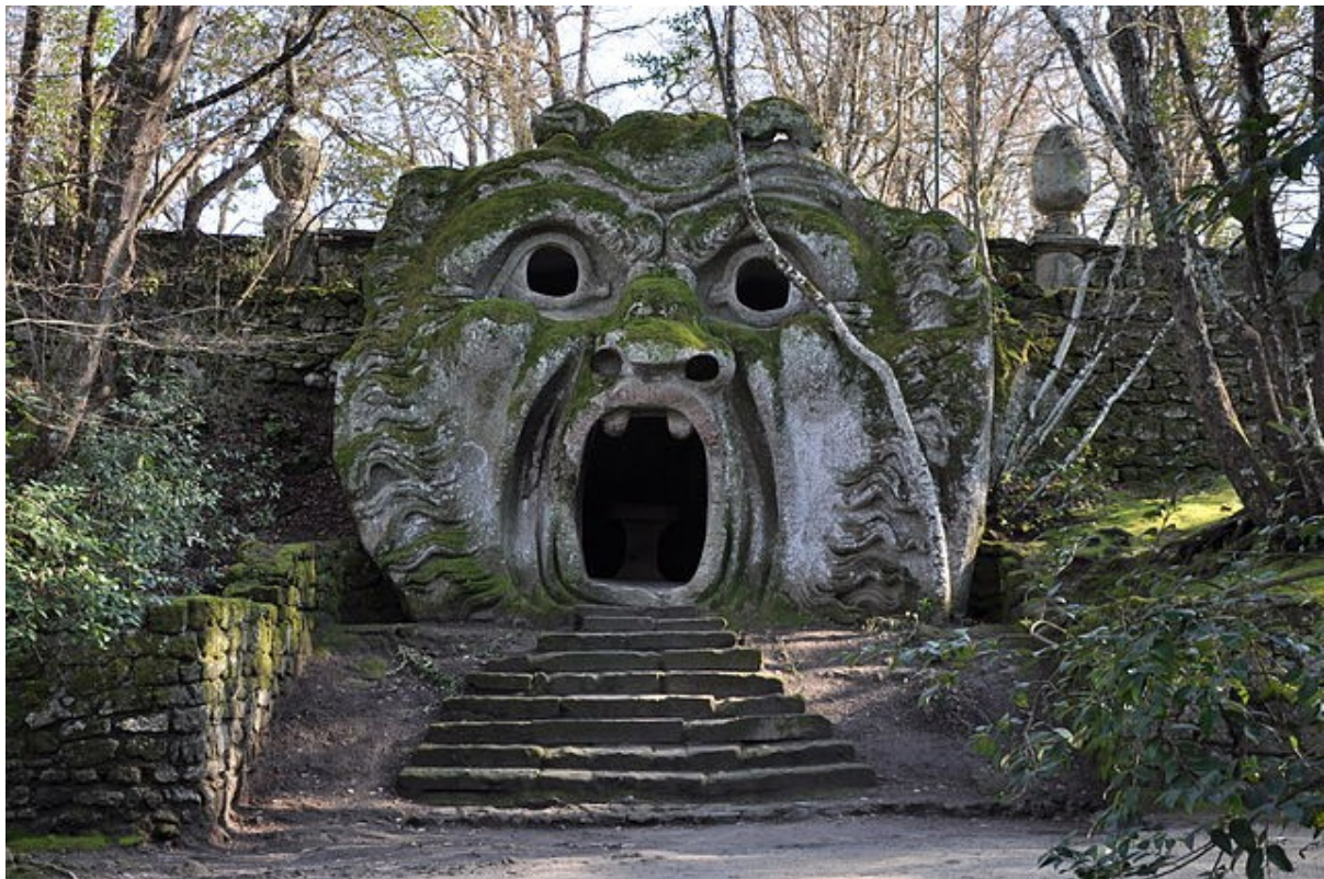
La porte d' Orcus dans les jardins de Bomarzo, Italie, XVIe siècle.

Orcus est le nom d'une divinité des Enfers. Orcus est à la fois un autre nom du dieu grec Thanatos et une divinité infernale romaine distincte.