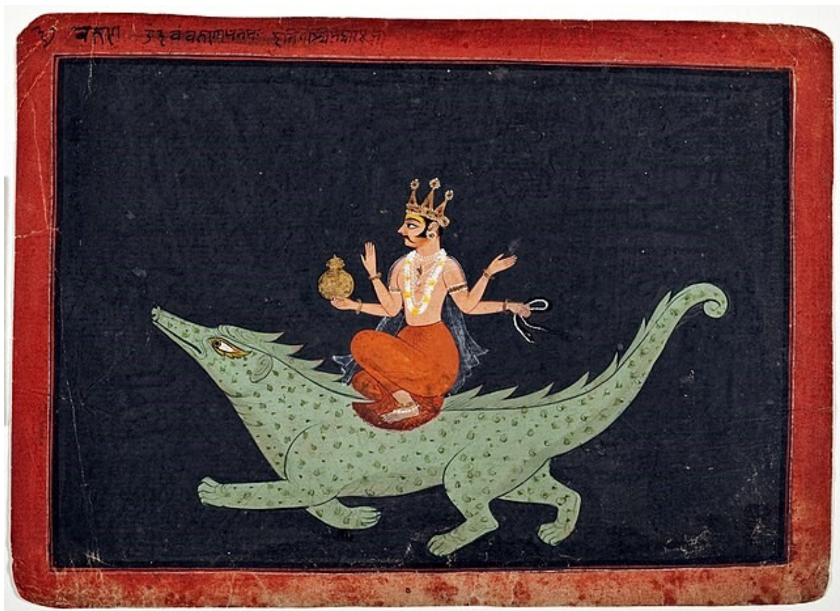
Varuna sur le Makara (animal aquatique du bestiaire mythologique de l'Inde) Rajahstan, fin du XVIIe siècle.

( https://commons.wikimedia.org/wiki/File:Varunadeva.jpg#/media/Fichier:Varunadeva.jpg )