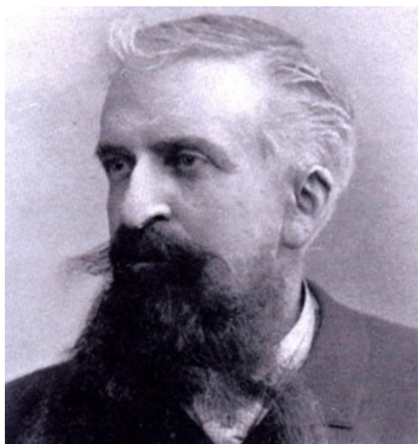
Gustave Le Bon