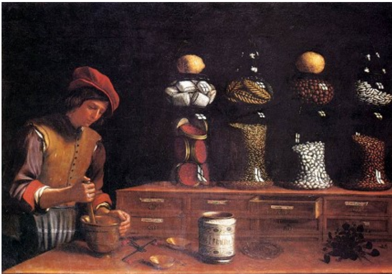
← La Boutique d'Épices , 1637, (Pinacoteca Comunale, Spoleto)

Paolo Antonio BARBIERI , né le 16 mai 1603 , est un peintre italien de natures mortes. Les sujets des tableaux de Paolo Antonio Barbieri sont des fleurs, des fruits et le jeu, mais il excelle particulièrement dans la peinture de poissons, qu'il a représenté avec une étonnante fidélité. Quelques unes de ses œuvres :