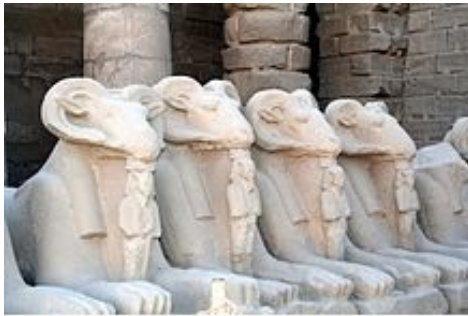
Les béliers du temple de Karnak

Chez les Babyloniens, le symbole du dieu Ea, le seigneur de l'Apsoû, domaine de l'eau douce sous la terre, était aussi une tête de bélier.