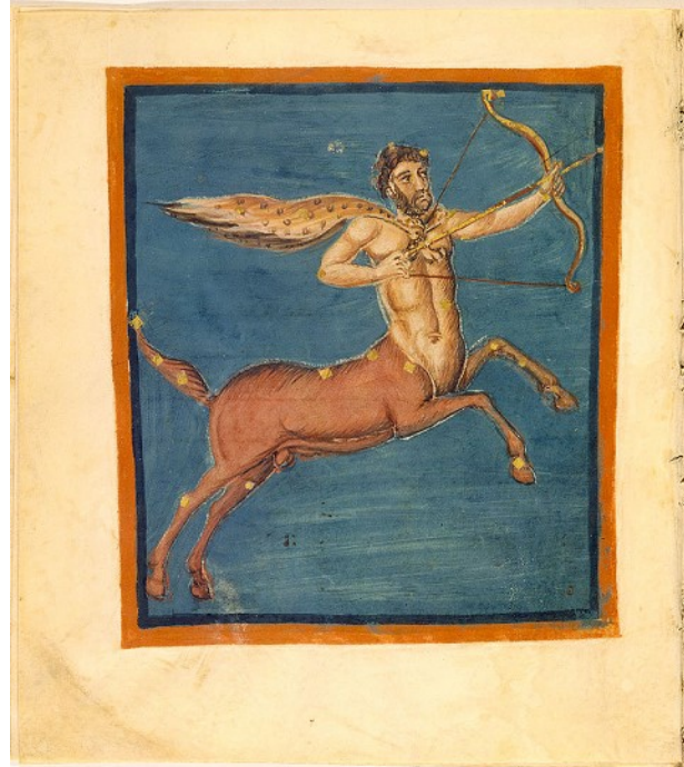
Crotos. (Folio 52v du manuscrit des Aratea de Leyde)

Dans la mythologie grecque, Crotos ou Krotos, quant à lui, est aussi un centaure, fils de Pan et Euphémé.