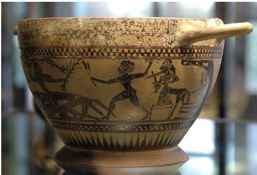
Héraclès, Pholos et les centaures, skyphos à figures noires, v. 580 av. J.-C., musée du Louvre

Pholos était fils de Silène et de la nymphe Mélia. Or la présence d'un thyrses branché entouré de lierre et de vigne dans la constellation du Centaure (hémisphère sud), semble attestée qu'il personnifie plutôt cette dernière.