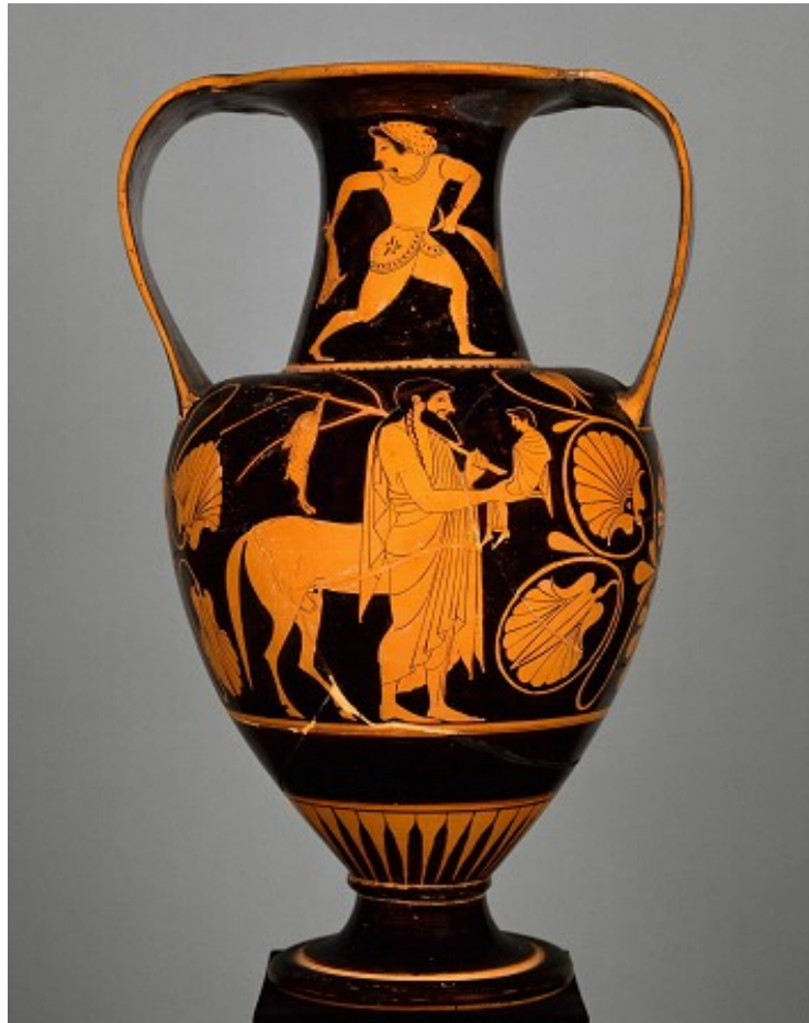
Achille et Chiron (vers 525-515 av. J.-C.)

le Soleil auxquels sont attachés ces dieux, traversent la constellation du Sagittaire justement) lui avaient enseigné la chasse (d'où « l'Archer »), la médecine, la musique et la divination. Versé dans la connaissance des plantes, il en avait retiré l'art de guérir. Le dieu de la Lumière lui confia d'ailleurs ensuite son fils, Asclépios. La proximité de la constellation du Sagittaire avec celle du Serpenteaire, Asclépios, justifiera par conséquent plutôt sa personnification avec Chiron.