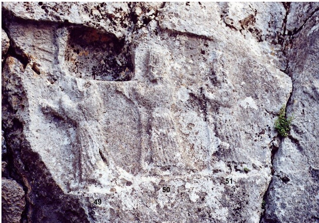
Ishara entre Allani et Nabarbi (déesse agraire) sur les reliefs Yazılıkaya (Turquie).

Son culte avait une large portée à travers l'ancien Proche-Orient. À diverses époques et régions, différentes fonctions lui ont été attribuées. A Ebla, elle était la divinité tutélaire de la famille régnante, mais aussi une déesse de l'amour.