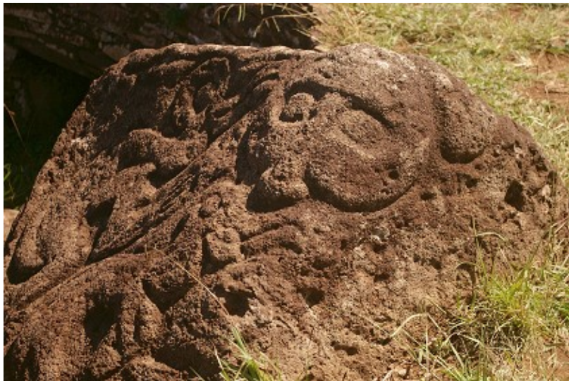
Pétroglyphe à l'effigie de Makemake (sous le masque).

(136472) Makemake est une planète transneptunienne (plutoïde) du Système solaire, située dans la ceinture de Kuiper. Elle est la troisième plus grande planète naine et le troisième plus grand objet transneptunien connu, après Pluton et Éris, et le deuxième objet transneptunien le plus visible, là encore après Pluton. En juillet 2008, l'UAI fait de Makemake la quatrième planète naine au même titre que Pluton déclassé.