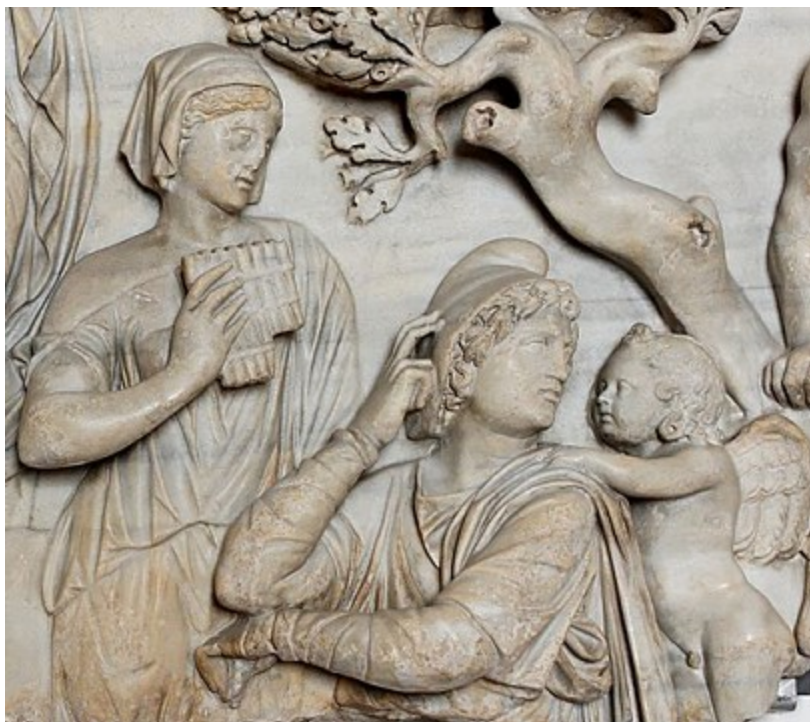
Pâris et Éros , en compagnie d'Énone. Détail d'un sarcophage romain de l'époque d'Hadrien. Palais Altemps (Rome)

Pâris », et semble même influencer le jeune homme sur certaines représentations artistiques.