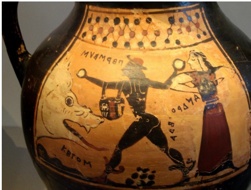
. Persée, Andromède et le monstre marin. Vase corinthien. Altes Museum de Berlin

Dans la mythologie grecque, Céto (du grec ancien « monstre marin ») est une divinité marine primordiale. Envoyée par Poséidon, Céto est combattue par Persée (muni de la tête de Méduse qu'il vient de tuer), désireux de sauver Andromède sacrifiée après que sa mère, Cassiopée, ait déclaré qu'elle était plus belle que les Néréides, parmi lesquelles Amphitrite, épouse du dieu de la mer. Notons que le nom Andromède signifie « la « souveraine des hommes », de nos jours plutôt la « souveraineté des êtres humains ».