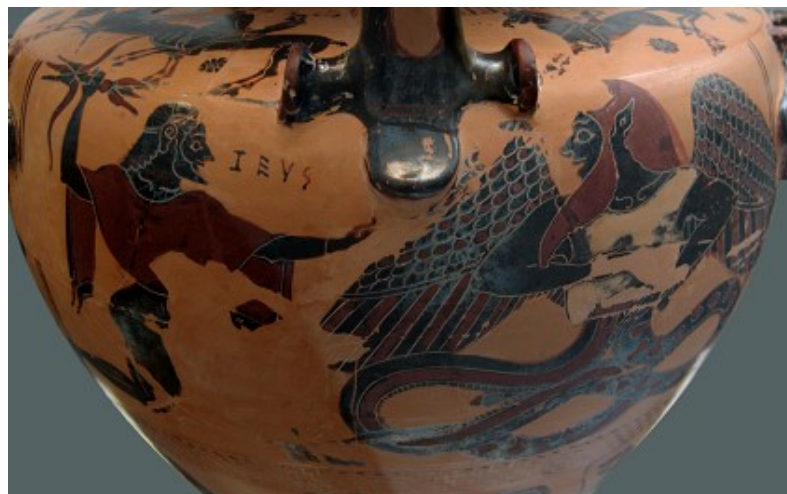
Zeus dardant son foudre sur Typhon, hydrie à figures noires, v. 550 av. J.-C., Collection des Antiquités

L'une des traditions (Hymne homérique à Apollon) fait de lui un démon enfanté par Héra pour se venger de Zeus. Lors du combat de Typhon contre le dieu, le Titan arrive à vaincre Zeus. Cependant le dieu suprême trouve un allié en Hermès ou Cadmos qui le délivre. Ainsi Zeus finit par le foudroyé et l'ensevelir sous l'Etna.