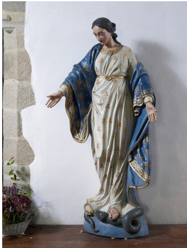
Vierge écrasant un serpent Église Saint-Florent de Plufur (Côtes-d'Armor, Bretagne)

En effet, Andromède est sacrifiée à Céto, le monstre marin envoyé par Poséidon pour se venger de la mère de celle-ci, Cassiopée, qui avait proclamé que sa fille était d'une beauté égale à celle des Néréides dont Amphitrite, l'épouse du dieu. Le nom grec d'Andromède, signifie « souveraine des hommes », que l'on peut élargir de nos jours à la « souveraineté des peuples » et notamment « le droit des peuples à disposer d'eux-mêmes », c'est-à-dire de se gérer eux-mêmes directement, sans intermédiaires extérieurs, et plus largement ni chef d'état à l'intérieur, afin de ne pas en être dépendants, esclaves. C'est effectivement, ce que réclament un certain nombre de manifestants en ce moment du fait de la corruption de quantité de politiciens ayant des conflits d'intérêts avec de grandes firmes industrielles, ou autres paradis fiscaux... Non sans relation d'ailleurs avec l'idée de « péché originel » qui va justement jusqu'à l'idée d'une nature totalement corrompue. Car certes Andromède a été sauvé par Persée, cependant son pied gauche (Almach) semble vouloir se diriger vers la tête de Céto (Menkar) pour l'écraser, ce qui n'est pas sans faire penser chez les chrétiens, à la Vierge écrasant le serpent du péché originel avec son pied.