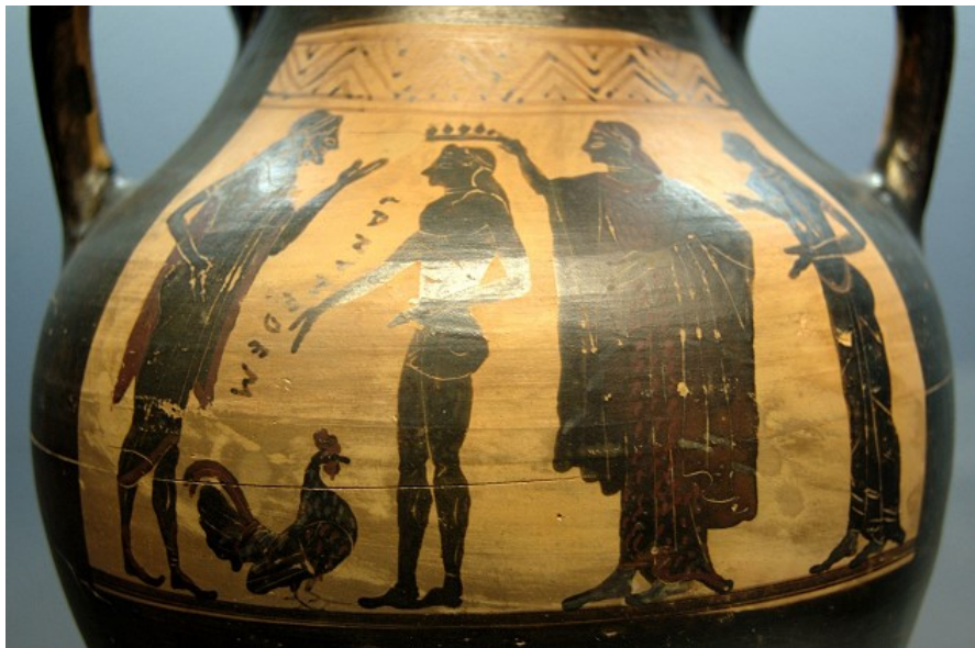
Ganymède sur l'Olympe, entouré de Zeus qui lui a offert un coq , une déesse le couronnant et Hébé.