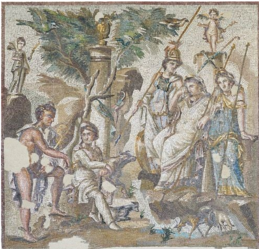
Jugement de Pâris

Éris qui est accompagnée d'Éros, le jour de son irruption au mariage forcé de Thétis avec Pelée, incite le choix d'Aphrodite justement à Pâris, c'est-à-dire l'amour sincère.