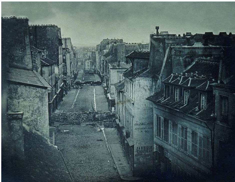
Barricades rue Saint-Maur, avant l'attaque des troupes du général Lamoricière, dimanche 25 juin 1848 à 7 h du matin

Mais cette République est encore fragile car très divisée.