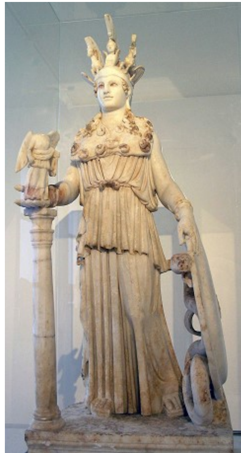
Athéna de Varvakeion