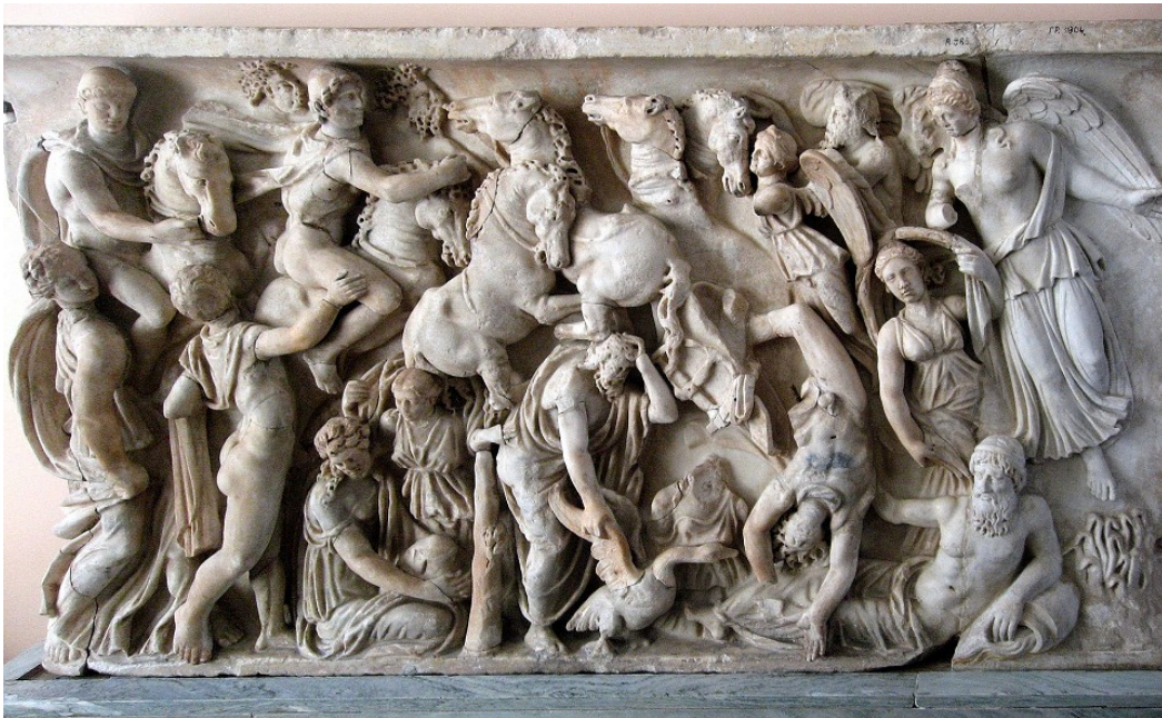
La chute de Phaéthon

Phaéthon n'est connu que pour sa chute : ayant emprunté le char solaire de son père Hélios, il en perdit le contrôle et embrasa le ciel et la terre. Zeus le foudroya.