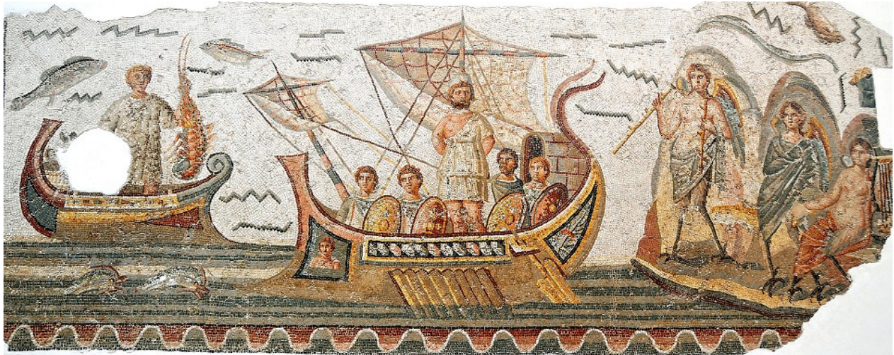
Ulysse et les sirènes

mât de son propre navire. Humiliées et désespérées, Parthénope et ses deux sœurs, Leucosie (« la blanche », nom dont sont dérivés les leucocytes ou globules blancs qui jouent un rôle important au sein du système immunitaire en participant à la protection contre les agressions d'organismes extérieurs ...) et Ligie (du grec « à la voix claire », donc l'annonce est tout aussi claire), se seraient jetées à la mer pour se noyer. Parthénope se serait échouée près de Naples.