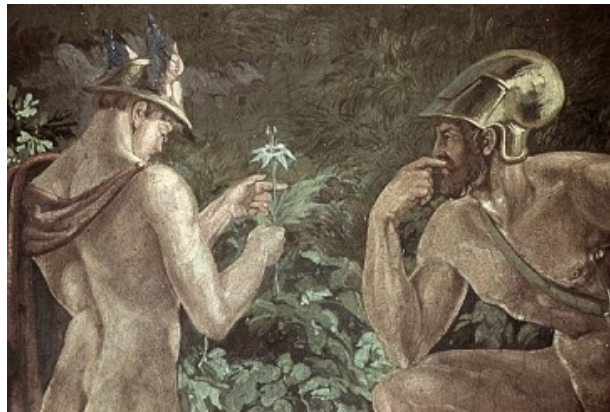
Hermès présente à Ulysse le moly

Le vaccin (Mercure) sera seul palliatif pour contrer un rejaillissement (Bélier) de la maladie.