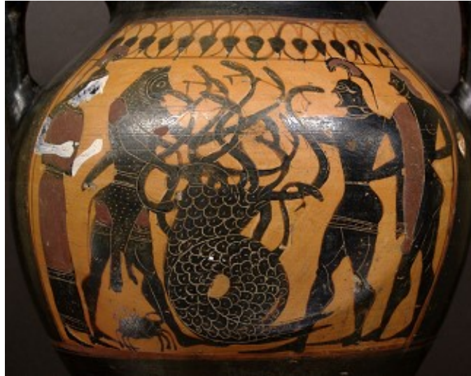
Héraclès et l'Hydre de Lerne

D'autre part, la constellation de l'Hydre dont la tête se trouve au niveau de la constellation du Cancer (d'où le crabe qui l'accompagne lors de son combat contre Héraclès), le cœur à la hauteur de celle du Lion, la suite de son corps continue en direction de celles de la Coupe (il s'agirait de la coupe tenue par Apollon ou de celle de Dionysos, donc bien un breuvage...) et du Corbeau (clin d'œil à ...Coronis-Coronavirus), se termine par la queue au niveau de la constellation de la Vierge et de la Balance.