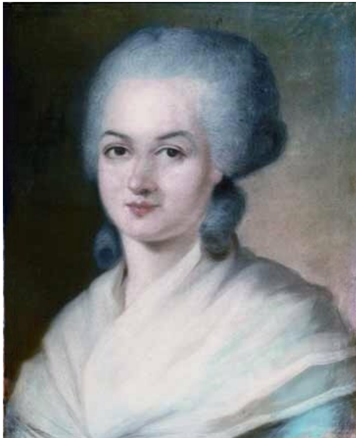
Olympe de Gouges

D'après Annette Rosa (Professeur au lycée Jacques Decour à Paris en 1988), après la chute de la Gironde les Montagnards cherchèrent à oublier Olympe de Gouges. Mais le 20 juillet 1793 elle se mit en contravention avec la loi de mars 1793 relative à l'interdiction des écrits remettant en cause le principe républicain. Ainsi sous le titre de Les Trois urnes ou le Salut de la patrie, par un voyageur aérien (Icare !) composa-t-elle une affiche qui demandait une élection à trois choix : république une et indivisible, république fédéraliste, retour à la monarchie constitutionnelle. Pour avoir proposé ce troisième choix elle fut arrêtée, par les Montagnards le 20 juillet 1793, jour de l'affichage du texte, et déferée le 6 août 1793 devant le tribunal révolutionnaire qui l'inculpa et la condamna à la peine de mort.