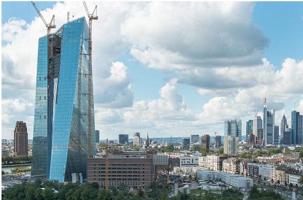
La Skytower, siège de la BCE à Francfort

gonfle, prête à exploser ! ... La BCE et la zone euro risquent d'en être les plus atteintes.