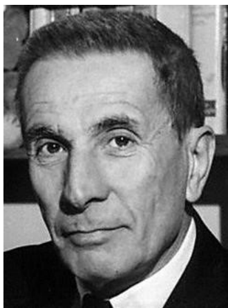
Dino Buzzati dans les années 1950