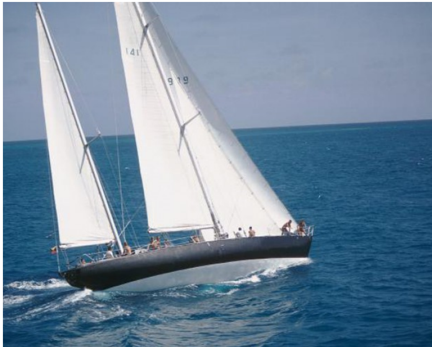
Le Pen Duick

C'est à la fois également braver les plus hauts risques, au péril de sa vie, dans le milieu maritime.