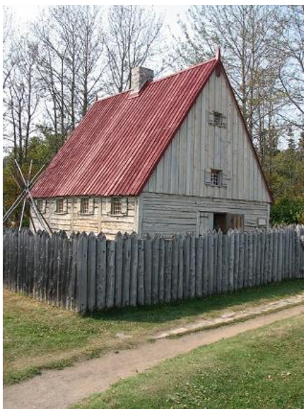
Réplique du poste de traite Chauvin à Tadoussac , fondé par Pierre de Chauvin en 1600, reconnu comme le plus vieux village du Québec. Il a fêté son 400e anniversaire en 2001.

Ces expéditions vers tout le continent américain entraîneront ainsi un basculement des cultures en Europe. La canne à sucre est introduite au Brésil. Des produits exotiques comme le chocolat, le maïs sont importés pour la première fois en Europe. C'est aussi l'introduction de la culture de la pomme de terre via l'Espagne, qui se répand ensuite dans tous les pays européens. C'est un véritable bouleversement alimentaire. C'est d'autre part la période de l'apparition du tabac. Pendant environ 200 ans, la fourrure sera notamment la ressource la plus importante de la Nouvelle-France et ensuite de la province de Québec. Ce commerce ne déclinera qu'au tournant des années 1800, c'est-à-dire avec le début de l'industrialisation.