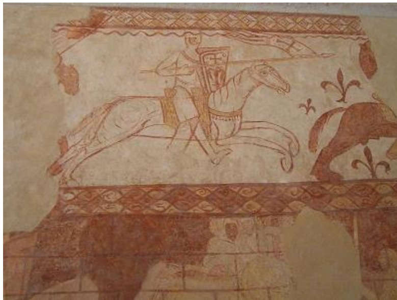
Chevalier du Temple chargeant sur son destrier.

Cet ordre fut créé à l'occasion du concile de Troyes, ouvert le 13 janvier 1129 (Éris 14° 17'R Vierge) , à partir d'une milice appelée les Pauvres Chevaliers du Christ et du Temple de Salomon, du nom du temple de Salomon que les croisés avaient assimilé à la mosquée al-Aqsa (bâtie, selon la tradition juive, sur les restes de ce temple). Il œuvra pendant les XIIe et XIIIe siècles à l'accompagnement et à la protection des pèlerins pour Jérusalem dans le contexte de la guerre sainte et des croisades. Il participa activement aux batailles qui eurent lieu lors des croisades et de la Reconquête ibérique. Afin de mener à bien ses missions et notamment d'en assurer le financement, il constitua à travers l'Europe chrétienne d'Occident et à partir de dons fonciers, un réseau de monastères appelés commanderies. Cette activité soutenue fit de l'ordre un interlocuteur financier privilégié des puissances de l'époque, le menant même à effectuer des transactions sans but lucratif, avec certains rois ou à avoir la garde de trésors royaux.