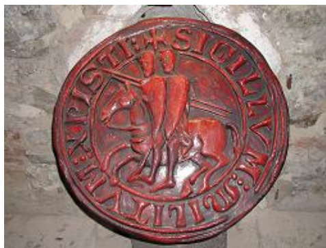
Reproduction de sceau templier lors d'une exposition à Prague.