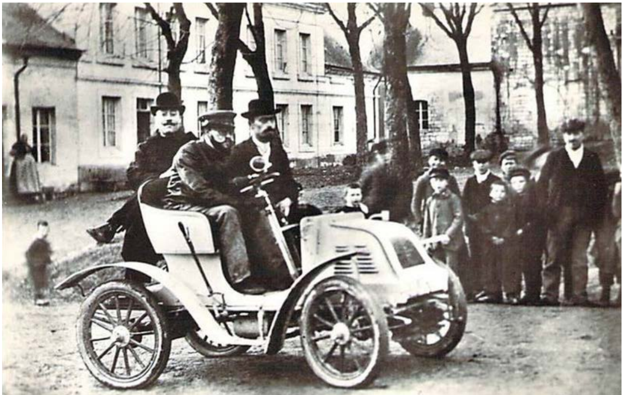
Photo : La Sirène de Henry Bauchet créée en 1899, première voiture avec prise directe, moteur de 5CV à l'avant, 2 cylindres en V, refroidissement par air, transmission sans chaîne, boîte de vitesses à pignons baladeurs et prise directe, allumage électrique redécouvert plus tard sous le nom de « Delco ».