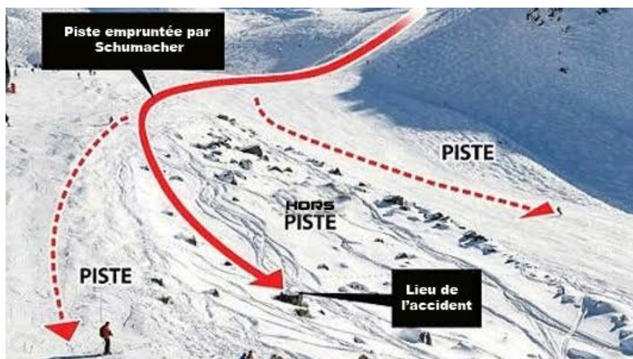
Lieu de l'accident à Méribel-Les Allues

[ Le dimanche 29 décembre 2013 entre 10 h 50 et 11h, à Méribel en Savoie, Michael Schumacher est victime d'un grave accident de ski. Alors qu'il se trouve en compagnie de son fils Mick et de trois amis, il descend sur une vingtaine de mètres dans une zone non balisée entre les pistes Georges Mauduit et La Biche, lorsqu'il heurte un rocher émergeant au-dessus de la neige, en effectuant un virage ; il retombe violemment et frappe de plein fouet du côté droit de la tête, l'arête d'un rocher en contrebas. Sous le choc, son casque éclate en trois parties. Schumacher, « sonné mais conscient », selon les pisteurs-secouristes qui interviennent quelques minutes après son accident, est dans un premier temps hélicoptéré vers le centre hospitalier intercommunal Alberville-Moûtiers puis évacué vers le centre hospitalier universitaire de Grenoble où il subit une opération en début d'après-midi. En fin de soirée, le CHU de Grenoble annonce que Michael Schumacher souffre d'un « traumatisme crânien avec coma qui a nécessité une intervention neurochirurgicale immédiate » puis, une heure plus tard, qu'il est atteint d'une hémorragie cérébrale et que son pronostic vital est engagé. ] (2)