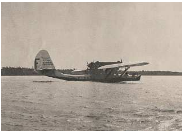
Le Latécoère 300 Croix du Sud

En juin 1936, il figure parmi les membres fondateurs du Parti social français dont il devient président.