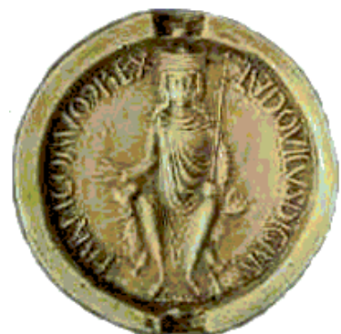
Sceau de Louis VII Paris, Archives Nationales

Louis VII le Jeune (17 ans) est de nouveau couronné à Bourges le 25 décembre 1137 (Éris 29° 39' Vierge trigone Saturne 26° Capricorne) .