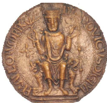
Sceau de Louis VI Paris, Archives Nationales

Louis VI le Gros meurt le 1 er août 1137 d'une dysenterie ( \mathbb{M} ).