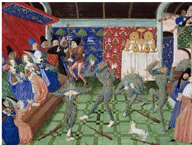
« Bal des ardents ».

Miniature attribuée à Philippe de Mazerolles,