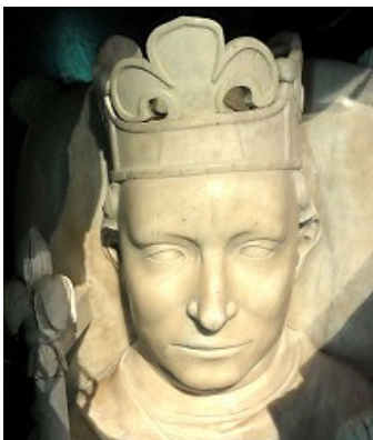
Gisant de Charles VI D'après masque mortuaire Saint-Denis

Éris maître de l'ascendant Balance démontre en partie la fragilité mentale de Charles VI dès la naissance, altérée en premier lieu par les décès de ses parents. Neptune en Poissons ne justifierait pas une telle influence.