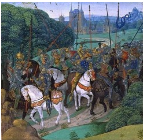
Charles VI saisi de folie (Le Mans),

Il est sacré roi de France le 4 novembre 1380. Sa minorité sera troublée par les querelles de ses oncles, les ducs d'Anjou, de Bourgogne, de Berry et de Bourbon, qui se disputent le pouvoir et s'enrichissent sur le dos de la population en l'accablant d'impôts. Malheureusement pour Charles VI, les revers du destin ne s'arrêtèrent pas là.