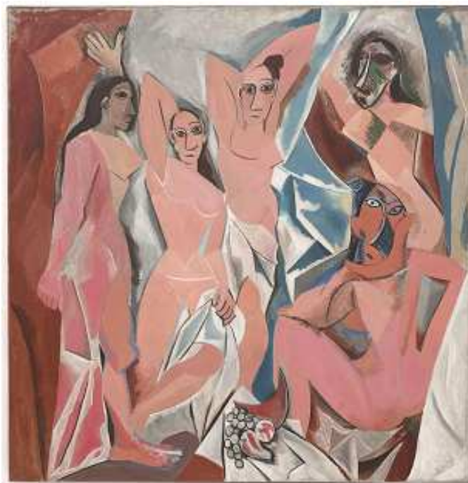
Les Demoiselles d'Avignon , 1910, l'œuvre fondatrice du cubisme.

Après Cézanne, Picasso et Braque transforment la vision en volumétrie concrète. En créant le courant du cubisme, ils abolissent la perspective, principe fondamental de la peinture depuis la Renaissance. Dès lors le spectateur est confronté à une image dont il peut faire le tour sans avoir à se déplacer : la troisième dimension entre dans l'espace bidimensionnel.